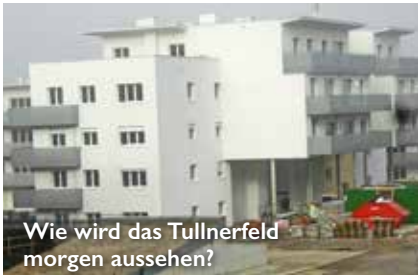
Wie wird das Tullnerfeld morgen aussehen?

Im Laufe des 19. Jhdts. begann durch wasserbauliche Maßnahmen, Begradigungen der Flüsse und Entwässerungen ein drastischer Wandel zu Lasten der Wiesen- und Weidewirtschaft und zu Gunsten des intensiven Ackerbaus. Mit dem voranschreitenden Strukturwandel in der Landwirtschaft durch Technisierung, Kommassierung und Intensivierung im 20. Jhd. formte sich das heutige Landschaftsbild des Tullnerfeldes.